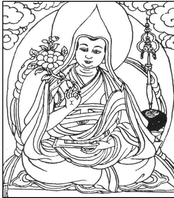
GYELWA GENDUN DRUP (1391 - 1474)